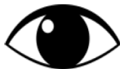
Ochi roșii care lăcrimează